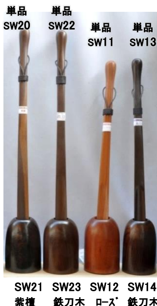
単品 SW20 単品 SW22 単品 SW11 単品 SW13