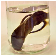
水に沈むほどの重厚さ

材料は唐木(重厚で世界的銘木です)で質感が違います 丈夫な材料ですので薄い仕上げが出来ます 靴に当たる部分が薄いので履きやすく出来ています 手作りでの温かさがあります 質感、機能性、オリジナルデザインそしてお買い得価格の4拍子揃った高級品です