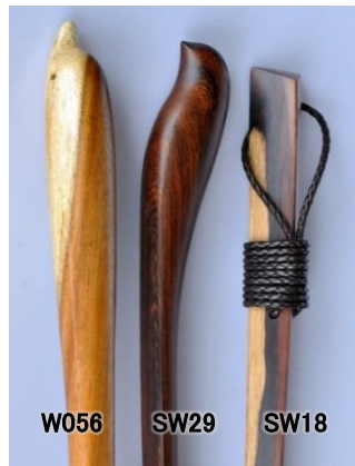
W056 SW29 SW18