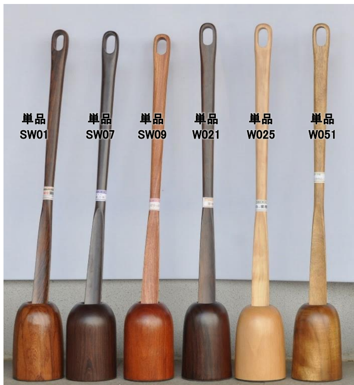
単品 SW01 単品 SW07 単品 SW09 単品 W021 単品 W025 単品 W051