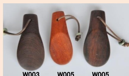
W003 鉄刀木 W005 紫檀 W005 紫檀