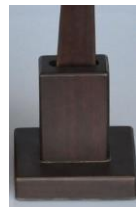
W018 しっかりした普及品