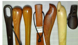
オリジナルデザイン

私たちの木の靴べらは サイズ、デザイン、用途、材質 そして価格帯などで 多様な品揃えです