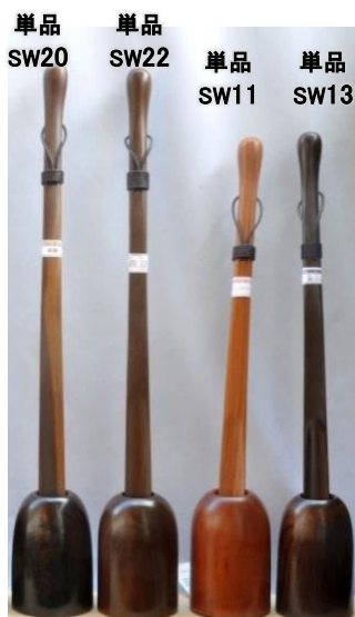
単品 SW20 単品 SW22 単品 SW11 単品 SW13