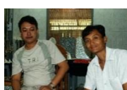
貝細工 ウイン工房