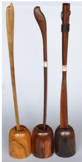
W057 マレーカリン SW30 紫檀 SW19 紫檀