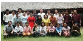
品質検査・木工加工 ヤンゴンAMC社