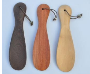
W030 W031 W032