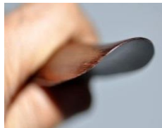
丈夫だから薄い仕上げ