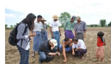
コットン栽培 ザガインファーム