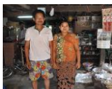
木工加工 コロコロ工房