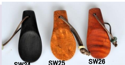
SW24 黒檀 SW25 天然木瘤 SW26 紫檀空