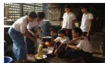
染色織物 アマナプラー織物学校