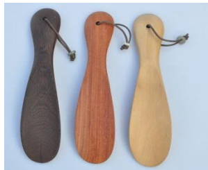
W030 W031 W032