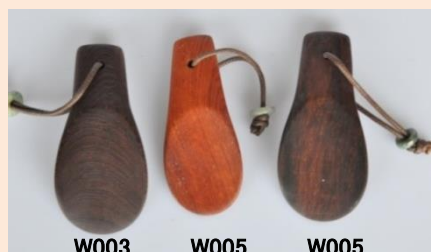
W003 鉄刀木 W005 紫檀 W005 紫檀