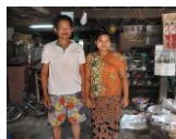
木工加工 コロコロ工房