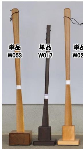
単品 W053 単品 W017 単品 W027