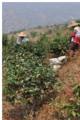
自然な環境での茶栽培