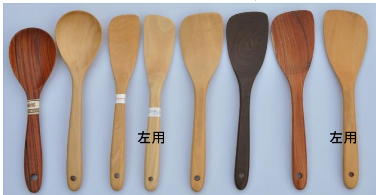
K26 K20 K08 K09 K31 K32 K33 K35